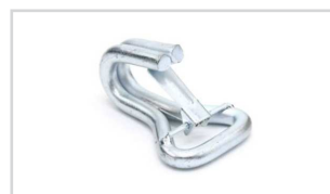
Spitzhaken mit Sicherung