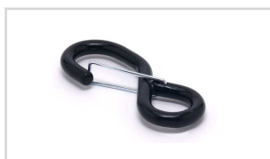
S-Haken mit Sicherung