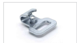
Flachhaken mit Sicherung